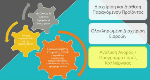
Γραφήματα, ανάλυση κόστους